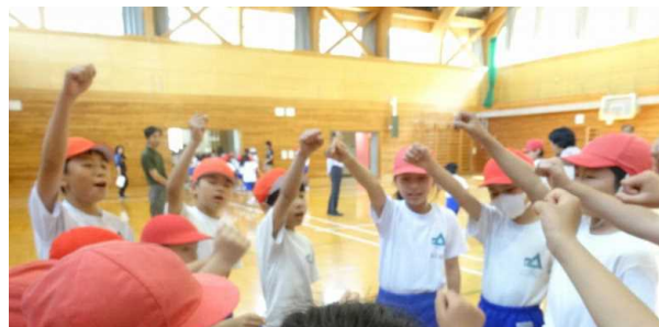
（文責 内田 繁樹）

4月28日には、「1年生を迎える会」、5月12日には、「縦割り班結団式」が行われました。学年関係なく仲良くなれる天城っ子は、みんなすてきですね。 <縦割り班結団式より>