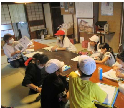
【↑6年生 しろばんば文学散歩(6/23・木)】

学校関係者評価委員会(5/27)や民生委員懇談会(6/17)では、学校経営方針についてのご助言や子供たちの様子についての情報交換などを熱心にしていただきました。交通安全を語る会(6/8)では、通学路の危険箇所について6年生と話し合うとともに、リーダーとしての役割について警察官よりご指導をいただきました。下級生の命を預かる登校リーダーの責任を、あらためて実感させられた時間でした。