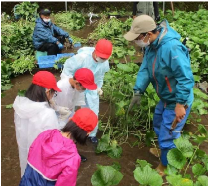
【↑3年生 わさび収穫体験(6/8・水)】

5月から6月にかけて、天城小学校では地域の皆様にお世話になる機会が多くありました。