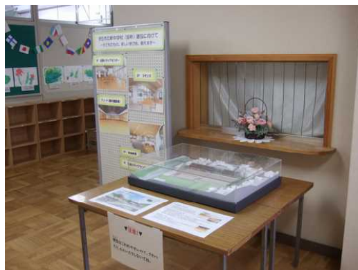
【新中学校の立体模型】

10月21日(金)には、天城小体育館で、保護者説明会を開催いたします。午後7時からの開催で、お疲れのところ誠に恐縮ですが、子どもたちのために、よりよい新中学校を創っていくために、多数の皆様の御参加をお願いしております。