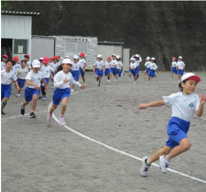
【↑ 持久走記録会 (12/1・木)】