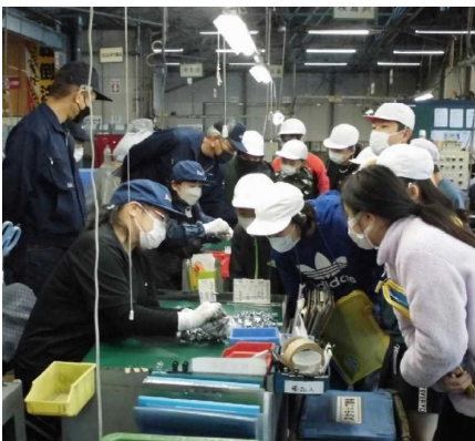
【↑ 5年「鈴和製作所」見学 11/25・金】

早いもので、82日間の2学期が終わりに近づきました。運動会や持久走記録会などの学校行事で活躍した子供たちの姿や、日々教室で見せる真剣な学びの顔など、心に残るシーンが数多くありました。また、校外で学ぶ機会も多くあり、その時々御家庭や地域の皆様が学校を支え、子供たちとふれ合っていた、児童の成長を支援してくださりました。皆様方の多大なるご理解とご協力に、心より感謝を申し上げます。