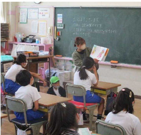
【 ↑ 昨年度の読み聞かせの一コマ 】

天城小学校では、令和4年度末をもって全保護者の皆様による読み聞かせ活動を終了し、新たにボランティアを募って実施することにしました。