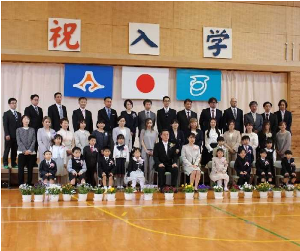
【 ↑ 令和5年度 入学式（4/7・金） 】

4月7日（金）、天城小学校ではぴかぴかの14名の新生を迎え、入学式を挙行了しました。